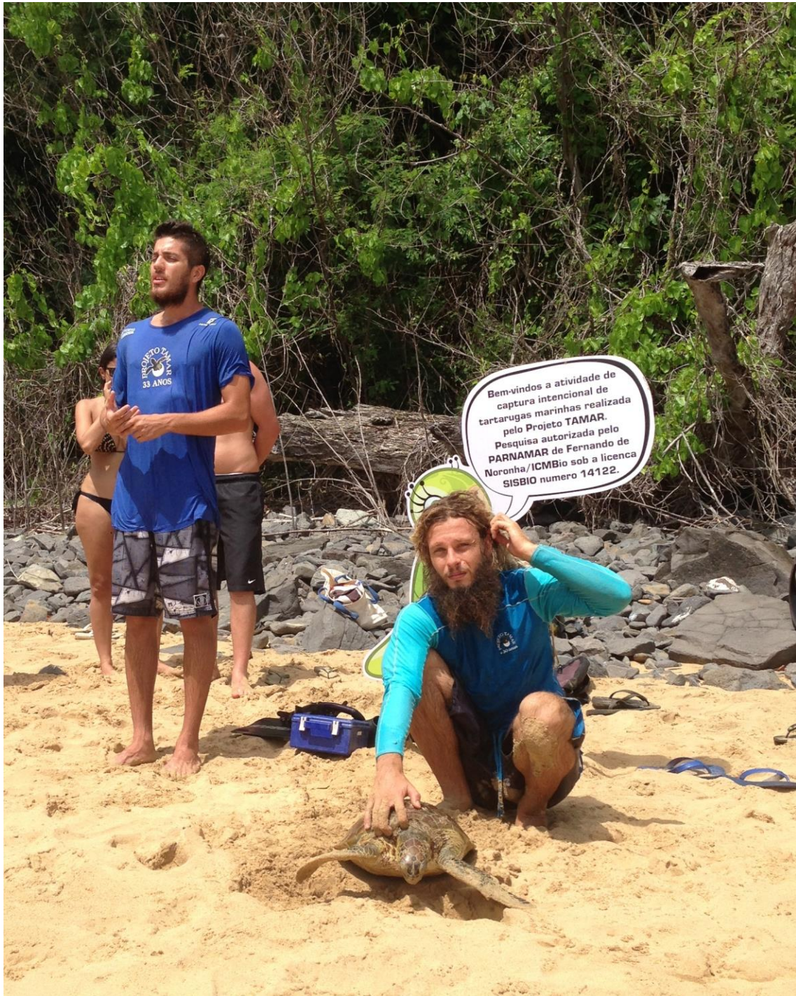
Figura 1. Atividade de captura realizada pelos pesquisadores do Projeto Tamar, nas praias de Fernando de Noronha.