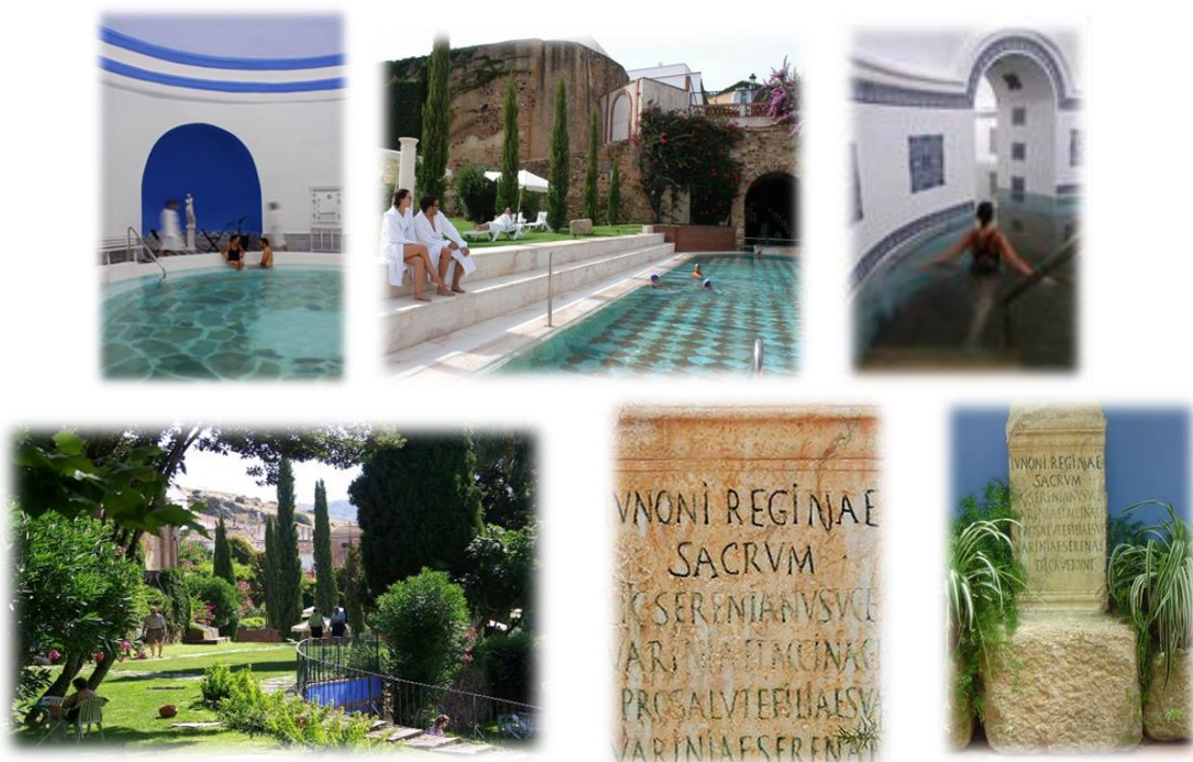
Figura 2. Estampas de Alange (Extremadura, España)